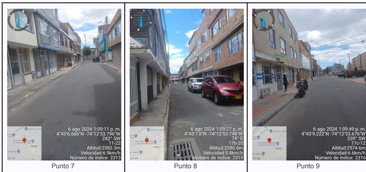
Ilustración 2. Fotos de los puntos del Recorrido de Control Y Vigilancia.